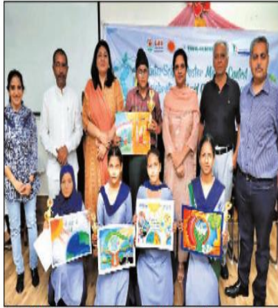
विश्व ओजोन दिवस पर इंटर-स्कूल पोस्टर मेकिंग प्रतियोगिता आयोजित। आज समाज